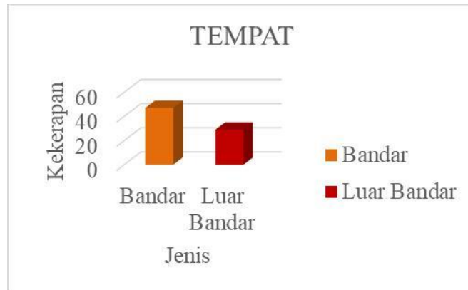
Taburan Mengikut Pengalaman dalam Pendidikan Luar